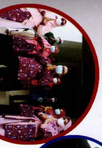
KETUA STIK MUHAMMADIYAH PONTIANAK CIVITAS AKADEMIKA